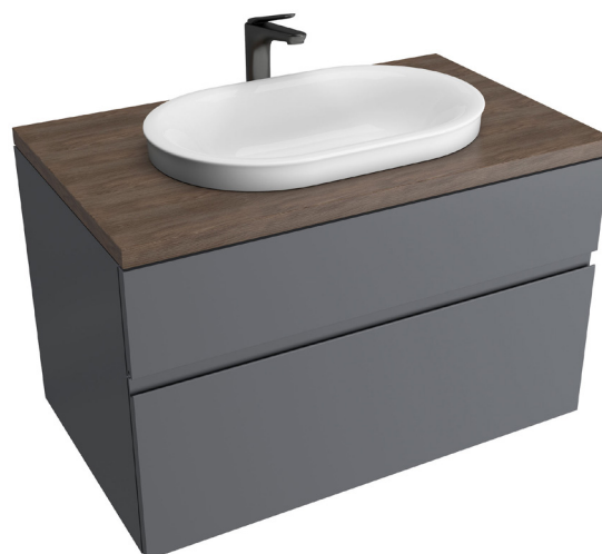
Illustration du lavabo au-dessus du comptoir Studio S 1296000 avec le dessus du lavabo 7813001, le meuble-lavabo de 33 po 8726033 et le robinet monobloc

VOIR LES DIMENSIONS BRUTES AUX PAGES SUIVANTES